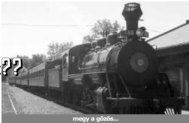
megy a gőzös...