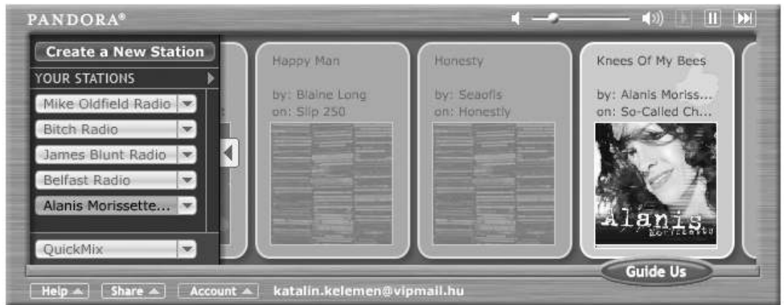
A lejátszó. Egyszerű, de nagyszerű.

téseket, helyettük valahol a "thumbs up" és a "thumbs down" gombtól egy kattintásnyira (ezekkel jelezzük neki, hogy örülünk-e a számnak vagy sem) udvarias linkeket helyez el az Amazon és az iTunes oldalára, ahol néhány további kattintással megvásárolhatjuk az adott számot vagy az azt tartalmazó albumot. Gondolom, már mindenki rájött: minden egyes vásárlásból néhány cent átvándorol Pandora bankszámlájára. (Hozzá kell tenni, civilizáltabb társadalmakban a DC helyett egyre inkább dívik a zenék megvásárlása.) Mivel a felhasználó, vagyis a hallgató folyamatosan arra törekszik, hogy minél